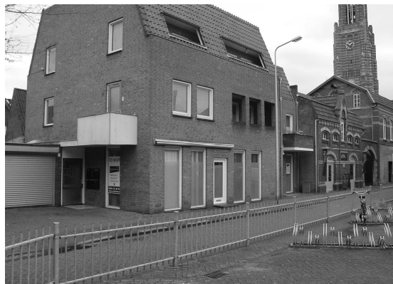
Veiligheidshuis Midden-Limburg, vestiging Weert

Het Veiligheidshuis Midden-Limburg gaat in januari 2007 van start. Dit dankzij een startsubsidie van de Provincie Limburg. Er komt een vestiging in Roermond (Koetshuis) en een vestiging in Weert (Hegstraat 6). Dit jaar nog wordt een kwartiermaker / coördinator Veiligheidshuis gewonnen en een ondersteuner. Vanuit Justitie zullen ook twee medewerkers in het Veiligheidshuis worden gehuisvest. Eerste stap is een lijst opstellen van personen die volgens de Veiligheidshuismethode worden aangepakt. Het gaat in eerste instantie om een tiental volwassen veelplegers en een tiental jeugdige veel- en meerplegers. Het Veiligheidshuis Midden-Limburg is een groeimodel: we beginnen met een aantal individuele gevallen, doen hiermee ervaring op en we leren en bouwen verder aan de netwerksamenwerking én aan de persoonsgerichte aanpak.