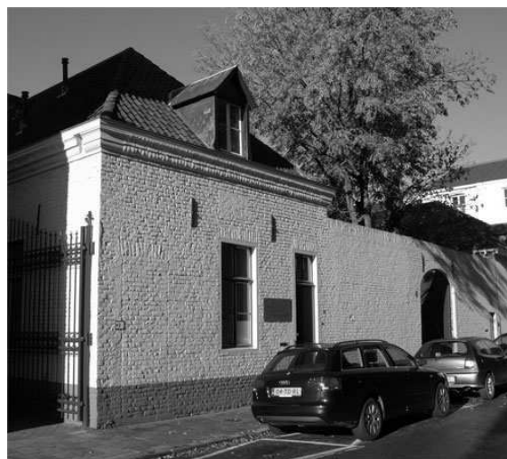
Veiligheidshuis Midden-Limburg, vestiging Roermond

De Veiligheidshuismethode is een methode waarbij vertegenwoordigers van verschillende organisaties (denk aan Openbaar Ministerie, politie, bureau jeugdzorg, GGZ, raad voor de kindbescherming, woningcorporaties, welzijnsinstellingen e.d.) samen de situatie van een veelpleger bespreken en samen een aanpak vaststellen en uitvoeren. De aanpak heeft betrekking op de combinatie van begeleiding naar een woning, naar werk, begeleiding in het afkicken van een verslaving, hulp bij het verkrijgen van sociale vaardigheden, omgaan met agressie, en/of schuldhulpverlening. De partners bekijken wat de veelpleger op de verschillende leefgebieden nodig heeft en stemmen daar hun aanpak op af. De coördinator Veiligheidshuis voert hierin de regie: hij/zij zorgt er onder andere voor dat de juiste vertegenwoordigers van organisaties om de tafel zitten, zorgt voor de opbouw van het dossier, voor concrete afspraken tussen de partners en voor heldere afspraken met de veelpleger zelf.