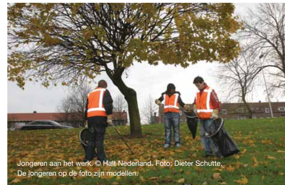
Jongeren aan het werk. De jongeren op de foto zijn modellen.

Bron: Ton Nabben, Jennifer Doekhie en Dirk Korf, m.m.v. Marijn Everartz, Beleving van de werkstraf in de buurt door jongeren , 2010, Bonger Instituut voor Criminologie, Faculteit der Rechtsgeleerdheid, Universiteit van Amsterdam.