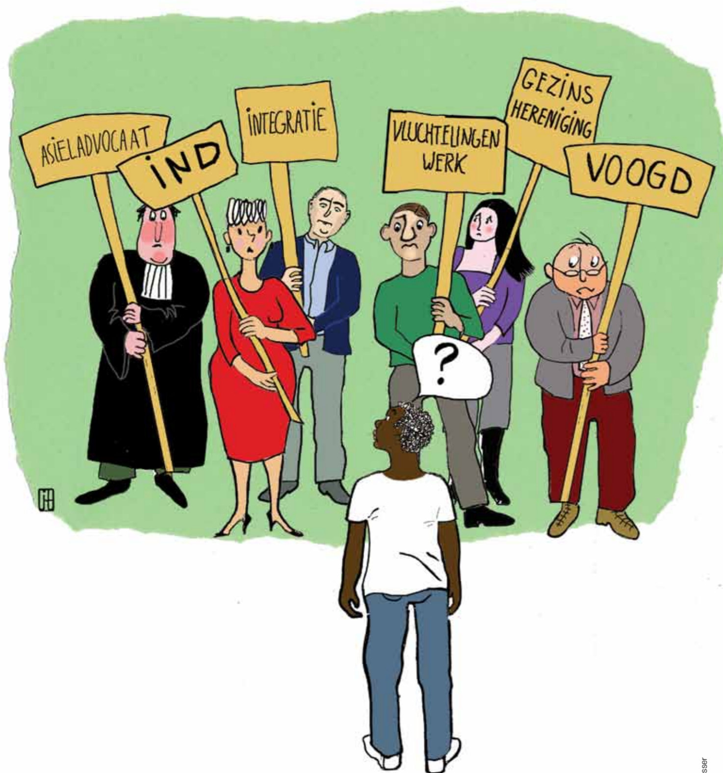
Illustratie: Josee Tesser