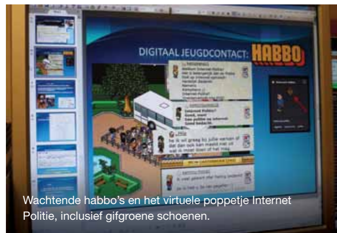
Wachtende habbo's en het virtuele poppetje Internet Politie, inclusief gifgroene schoenen.

Het kopen van de Habbo-credits is waarschijnlijk een aankoop die past bij twaalf- tot achttienjarigen. Het gevaar bestaat echter dat kinderen ongemerkt veel geld uitgeven aan de credits.