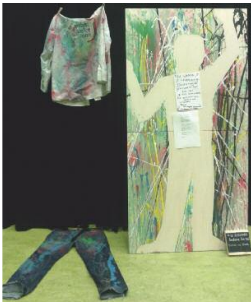
Bewoners van Hostel De Hoek in Utrecht maakten dit doek door hun werkcoach te bekogelen met verf. Zijn silhouet bleef 'onbevlekt' achter, wat twee bewoners weer inspireerde tot het schrijven van een gedicht.

Zo'n 25 cliënten en bezoekers van het Leger des Heils hadden hiervoor een kunstwerk gemaakt. En dankzij live-muziek, activiteiten voor kinderen en de catering door 50150 Food, een werkervaringsbedrijf van het Leger des Heils, werd het een feestje waar behalve familie en vrienden van de kunstenaars ook veel mensen uit de buurt op afkwamen.