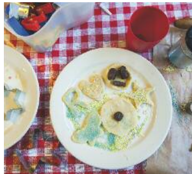
Vanwege privacy zijn de namen ‘Loes’ en ‘Diana’ gefingeerd