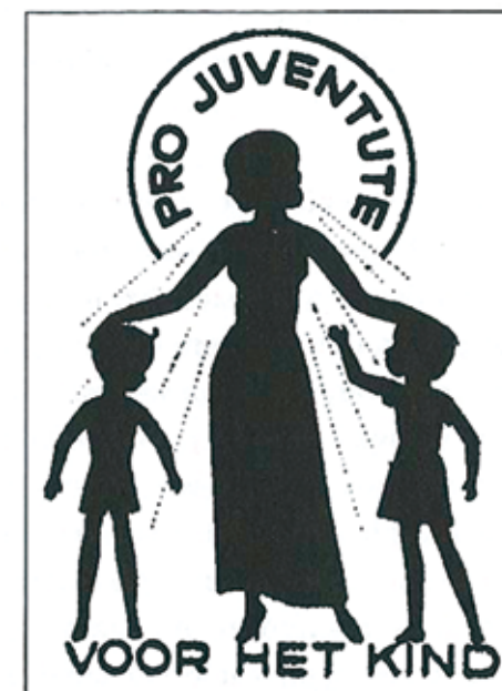
Illustratie: Oud logo Pro Juventute

Stel meer burgers aan als voogd. Dit voorstel wordt op dit moment al ingevoerd. Het zit namelijk in de methode Voogdij die dit jaar en volgend jaar wordt ingevoerd. Hierbij gaat het enerzijds om pleegouders die de voogdij krijgen over hun pleegkind en anderzijds om burgers die het gezag op zich nemen over een jeugdige die niet in een pleeggezin, althans niet in het gezin van de voogd, verblijft. Bij het ontwikkelen van de methode Voogdij bleek dat er in theorie wel steun was voor dit idee maar dat het in de praktijk nauwelijks van de grond kwam. De voogden vonden het moeilijk om geschikte zaken te vinden. Pleegouders wilden het niet want ze wilden een neutrale instantie tussen hen en de eigen ouders van het kind. Of pleegouders wilden het wel maar bureau jeugdzorg vond een neutrale buffer nodig, omdat pleegouders te weinig ruimte gaven voor het contact van het kind met de eigen ouders. Er zijn geen mensen die zich aanmelden om voogd te worden van een kind dat niet bij hen in het gezin woont. Er zijn tal van juridische, ad-