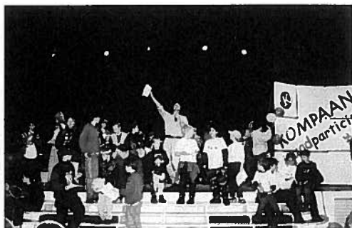
Jeugdparticipatie als creatie

Jeugdparticipatie. Het cliëntenbeleid is een onderdeel van het kwaliteitsbeleid van Kompaan. Het is bedoeld om de positie van cliënten te versterken en meer vraaggericht te werken. Een aspect van het cliëntenbeleid is de participatie van jeugdigen. Om dat vorm te geven, was er het project jeugdparticipatie als creatie: een Kompaanbreed project waarin jeugdigen vanuit een aantal afdelingen (MAAT, medisch kindertehuis, pleegzorg en gedragstherapeutische behandelgroepen) gevraagd werd om uitdrukking te geven aan hun beleving van de hulpverlening. Dit gebeurde op een creatieve wijze met behulp van drama, fotografie, muziek en beeldende vorming. Het project was een samenwerking tussen de opleiding Fontys Sociaal Pedagogische Hulpverlening en Kompaan. Op 24 november 1999 was er in De Avenue een feestelijke presentatie van de creaties. ZorgSaam betaalde de kosten van de presentatie. Naar aanleiding van dit project is de participatie van de jeugd verder uitgewerkt; een jongerenraad en kinderraad zijn opgezet en de inhoud en invulling van de huisvergaderingen is verbeterd. Sportartikelen en contributies. ZorgSaam betaalde voor 62 alleenstaande minderjarige asielzoekers sportartikelen en contributies voor jongeren van MAAT. Dit moest bijdragen aan de participatie en integratie van de ama's op het gebied van vrijetijdsbesteding. Bovendien is lichamelijke activiteit een prima afleiding in het onzekere bestaan van de jonge asielzoekers.