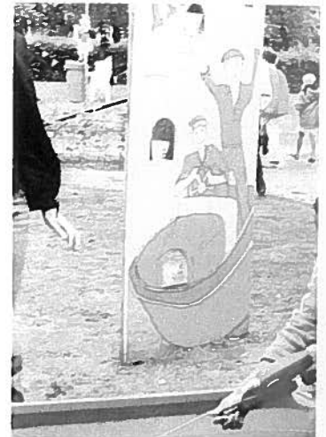
Jaarlijks is er op het terrein van Kompaan in Goirle een feestdag voor de jeugd. ZorgSaam doet regelmatig een duit in het zakje om van deze dag een succes te maken.

Met financiële ondersteuning van activiteiten wil ZorgSaam voor Jeugd hulp geven aan jeugd in de knel. Daarbij ligt een sterke nadruk op de regio Midden-Brabant en worden vooral innovatieve projecten ondersteund. Er is bijzondere aandacht voor projecten die worden voorgedragen door Stichting Kompaan of Bureau Jeugdzorg. De financiële hulp kan nieuwe vormen van begeleiding betreffen, maar ook rechtstreeks de leefsituatie van jeugdigen en hun ouders of verzorgers. De instellingen blijven zelf verantwoordelijk voor hun exploitatiekosten.