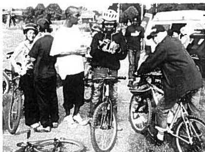
Vakantiekamp voor alleenstaande minderjarige asielzoekers en Nederlandse jongeren

De opbrengst van het vermogen in het voorgaande jaar minus de geldontwaarding is per jaar besteedbaar voor giften. Daarnaast verstrekt het fonds (renteloze) leningen. Aandachtspunten bij het beoordelen van aanvragen zijn onder andere: met name gericht op jeugd in Midden-Brabant, aandacht voor initiatieven van Kompaan, gericht op projecten op het gebied van zorgverbetering, zorgvernieuwing en kwaliteitsverbetering.