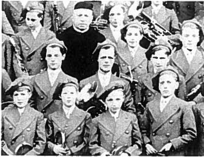
Giften werden gebruikt voor vrijetijdsbesteding zoals muziek maken. De harmonie Ons Genoegen van Huize Nazareth was een middel tot ontspanning, maar ook om sympathie bij de bevolking te winnen.