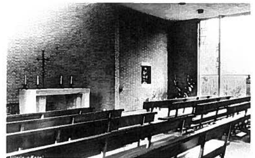
Het fonds Kinderzorg gaf een bijdrage voor de inrichting van de kapel in kinderdorp Sint Godelieve.

De fusie van de Stichting Sociaal Agogische Samenwerking, de Stichting Jeugdhulpverlening en Jeugdgezondheidszorg Brabant (Kleuterheil en Godelieve) en de Stichting Jeugd- en Jongerenwerk tot Kompaan was voor de fondsen Vrienden van het Kindertehuis Maria Goretti, het Mr. Jan van de Mortelfonds en Kinderzorg de aanleiding om ook samen te werken. In mei 1998 vormden de besturen een personele unie en op 10 juni 1999 tekenden de partijen de notariële akte van fusie. Zo onstond ZorgSaam: een ondersteuningsstichting voor de jeugd binnen de jeugdzorg. Het doel van ZorgSaam is het bevorderen van werkzaamheden alsmede het ondersteunen van nieuwe initiatieven op het gebied van jeugd-