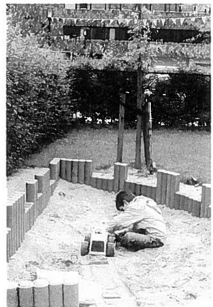
Zandbakken voor de kinderen van de dagbehandeling 0-7 jaar.